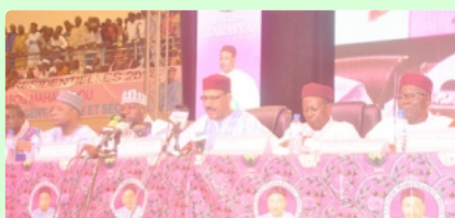
La table de séance

Le Parti Nigérien pour la Démocratie et le Socialisme (PNDS Tarayya) a tenu, samedi dernier dans la grande salle du Palais du 29 Juillet son congrès extraordinaire d'investiture. Au sortir de ces assises, SE Issoufou Mahamadou a été solennellement investi pour représenter le parti aux élections présidentielles de 2016 pour un second mandat et poursuivre ainsi ses actions de développement au service du pays. Ce congrès a enregistré une mobilisation exceptionnelle au niveau de la grande salle du Palais du 29 Juillet pleine à craquer. La cérémonie d'ouverture présidée par le président du Comité Exécutif National du PNDS Tarayya, M. Bazoum Mohamed.